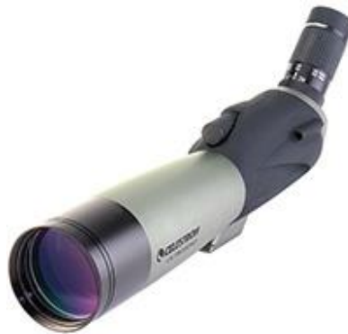
Ilustración 4: 20-60x 80 mm Celestron Ultima 80-45º.

Las unidades del ET disponen de diferentes sistemas de visión de largo alcance para cumplir con el objetivo de las misiones que se les encomiendan relacionadas con el reconocimiento, vigilancia y adquisición de objetivos. En concreto, un GT tiene un medio de visión terrestre Celestron, el visor 20-60x 80 mm Celestron Ultima 80 – 45º (véase ilustración 4) [16].