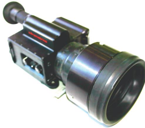
Ilustración 7: Visor MILCAM MK-2 (VILA).