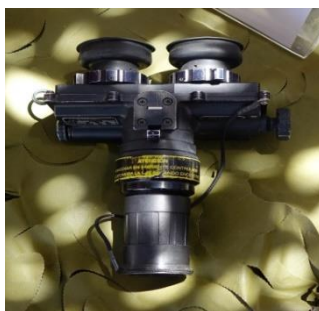
Ilustración 5: ENOSA GVN-201.

Un GT del ET realiza numerosos ejercicios nocturnos con el objetivo de instruir a cada uno de sus componentes y adiestrar a las unidades que lo conforman para estar en las condiciones requeridas y, así, llevar a cabo las misiones que se les encomienden. Para ello, utilizan algunos de los medios nocturnos de adquisición de objetivos en dotación del ET, como las gafas de visión nocturna ENOSA GVN-201, representadas en la Ilustración 5.