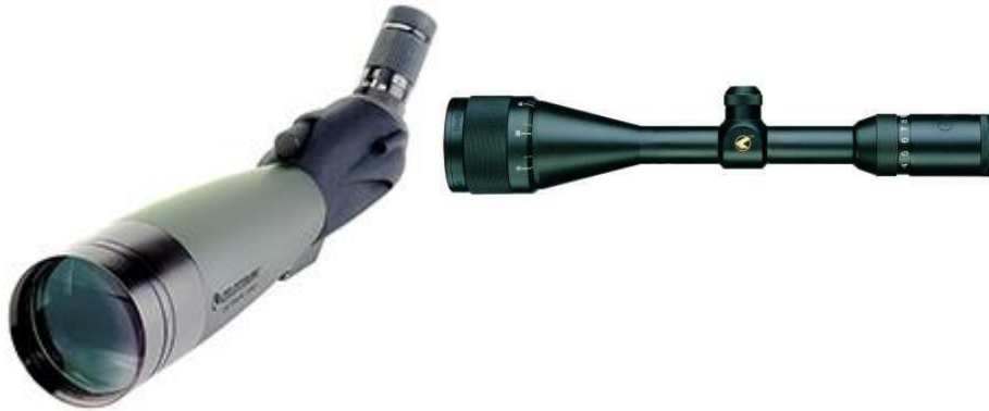
Ilustración 11: Visor 22-66x 100 mm.