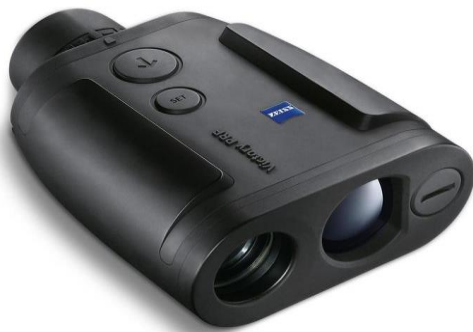
Ilustración 9: TL ZEISS Victory 8x26 T*PRF.