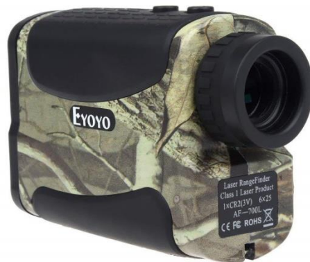
Ilustración 10: TL GOLF 7x26.