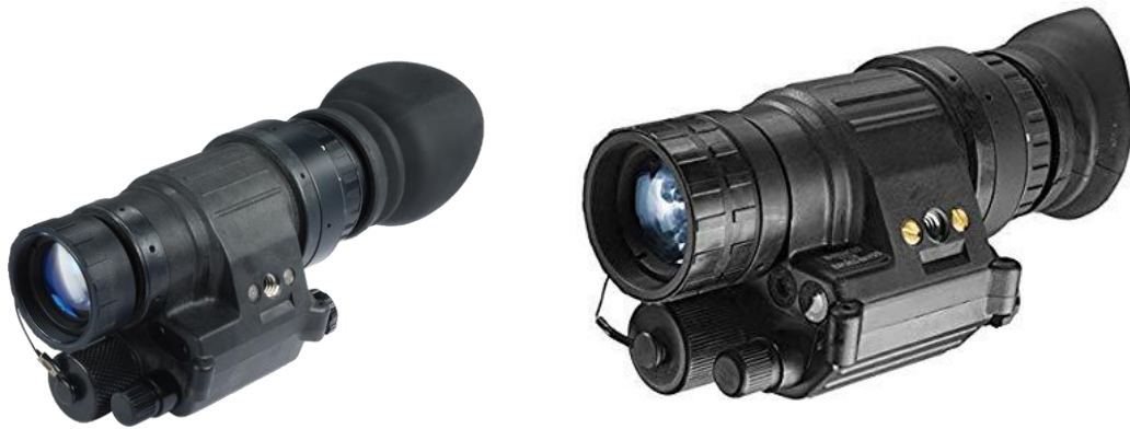
Ilustración 13: AN/PVS-14.