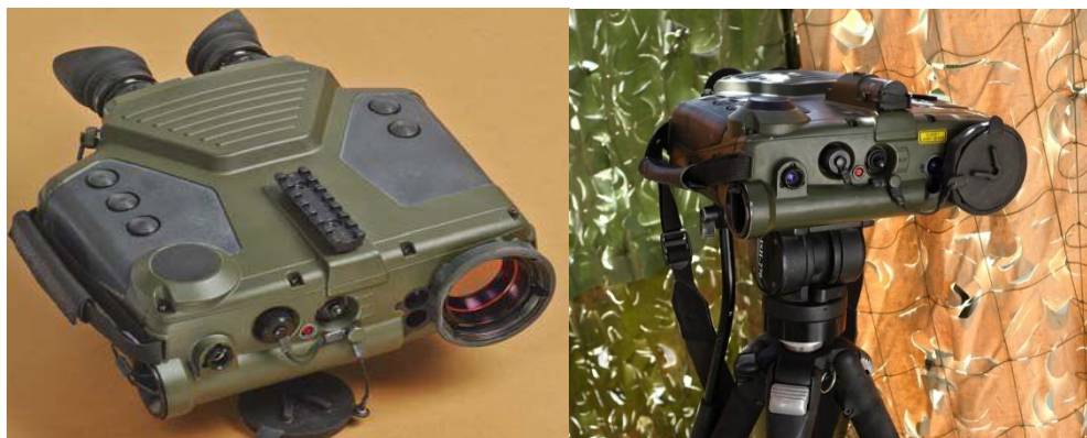
Ilustración 6: Cámara Térmica Coral CR-P.

La Cámara Térmica Coral CR-P es un conjunto binocular de dimensiones compactas, lo que favorece en su transporte y empleo desde posiciones discretas. Incluye una señal infrarroja para obtener imágenes del adversario tanto de día como de noche, zoom óptico continuo, telémetro láser, brújula y GPS, cuyas características están especificadas en la tabla 12.