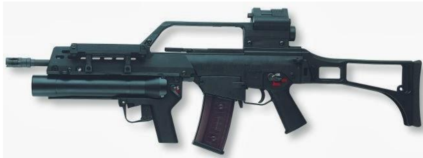
Ilustración 8: Visor FUSA 3x.