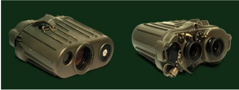
Ilustración 3: Telémetro láser EISA LP-7.