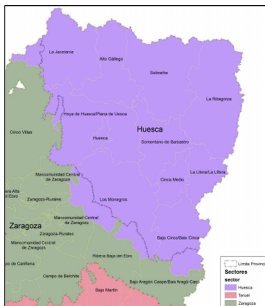
Fuente: Mapa de Servicios Sociales de Aragón, 2018.

necesidades sociales y favorecer la cercanía de los usuarios a las prestaciones sociales tanto equitativamente como universalmente. (Ver Anexo III)