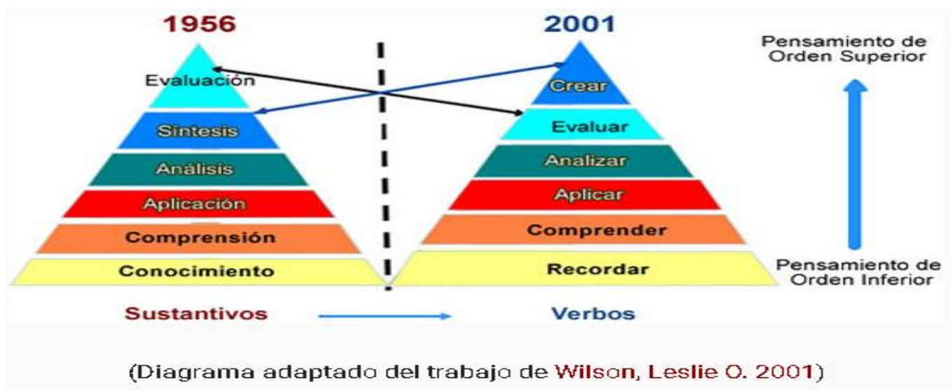
Gráfico 5.

Para ello se plantea utilizar la taxonomía de Bloom, en su vertiente cognitiva: