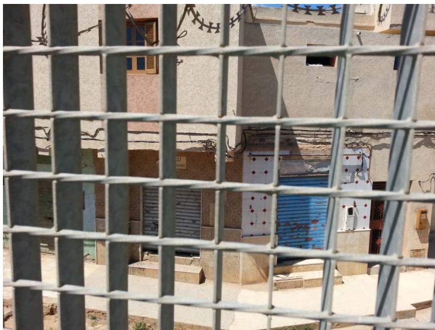
(Imagen 3: Paso fronterizo del Barrio Chino. La Zona Neutral está ocupada por todo tipo de tiendas y viviendas marroquíes a menos de 10 metros de la Verja española)