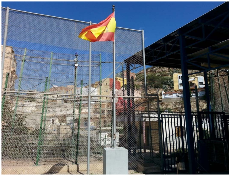
(Imagen 1: Paso fronterizo de Mariguarí; se puede apreciar la inexistencia de la Zona Neutral)