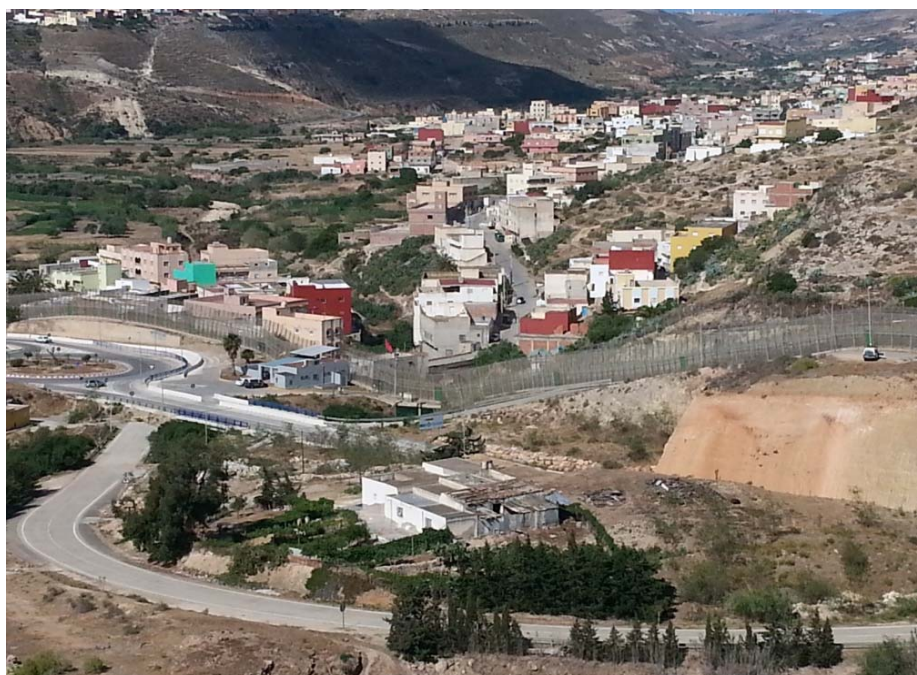
(Imagen 2: Vista panorámica del paso fronterizo de Mariguarí, tomada desde la Cuesta de la Peseta. No existe la Zona Neutral al estar ocupada por las casas de la localidad marroquí de Mariguarí)