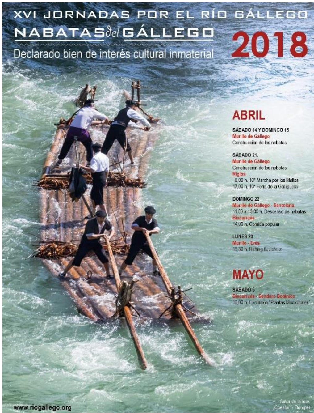
Imagen 5: Cartel promocional de las navatas del río Gállego.

A continuación, vamos a comentar y analizar las actividades presentadas en ambos programas de los años expuestos anteriormente.