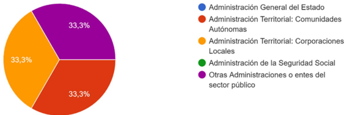
Gráfico 2: ¿En qué administración trabajas actualmente?

En el gráfico 2 puede verse como actualmente, de los que trabajan en el sector público hay un reparto a partes iguales entre las Corporaciones Locales, Comunidades autónomas y otras Administraciones o entes del sector público. Además, su trabajo, según ponen de manifiesto, tiene relación con los estudios de Gap.