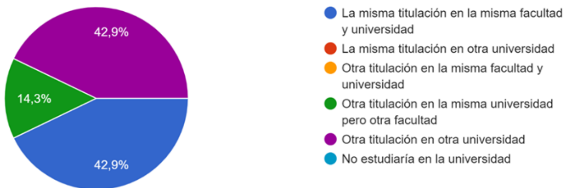
Gráfico 4: Si tuvieras que volver a elegir una titulación, ¿qué opción elegirías?

En definitiva, en el gráfico 4 observamos que si tuvieran que volver a elegir una titulación el 42,9% elegirían la misma y en la misma Facultad y Universidad.