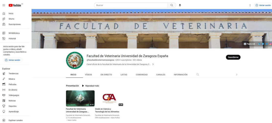
Figura 2. Listas de reproducción de los vídeos de las charlas de salidas profesionales en los Grados en Veterinaria y Ciencia y Tecnología de los Alimentos, ubicada en la plataforma de la Facultad de Veterinaria en Youtube ( https://www.youtube.com/c/facultaddeveterinariauniversidaddezaragozaespaña ).

Finalmente, el acceso a estas charlas a través de la plataforma de la Facultad de Veterinaria en Youtube ( https://www.youtube.com/c/facultaddeveterinariauniversidaddezaragozaespaña ) (Figura 2) permitirá acceder a futuras promociones, así como a la sociedad en general. También, permitirá realizar un seguimiento de las visualizaciones de estas charlas para poder medir el impacto a largo y medio plazo de este proyecto.